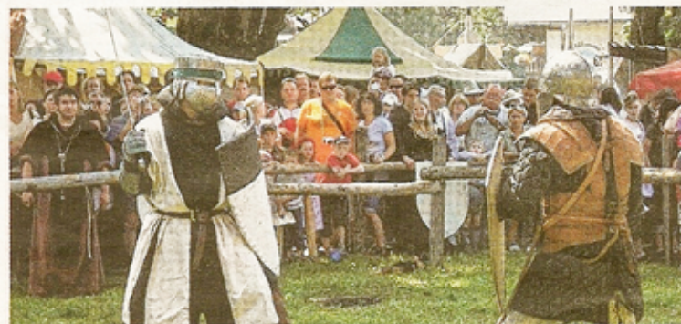
Das Burgfest in Kaprun ist bunt und spektakulär sowie ein echter Zuschauer magnet.

Burgherren und dem Burgfest-Team die Auszeichnung auf Burg Aggstein entgegen nahm. „Wir sehen die Ehrung als Auftrag, das Burgfest in bewährter Weise fortzuführen. Die huscarl-Leserschaft hat uns mit ihrem Voting, wie auch in den letzten Jahren, unter die fünf schönsten Mittelalterfesten Österreichs gekürt.“ Das Burgfest Kaprun wird heuer am 23. und 24. Juli 2011 in altbewährter Weise stattfinden und ist längst über die Grenzen des Pinzgaus hinaus eines der beliebtesten Kulturveranstaltungen. 50 Lagergruppen werden wieder ihre Zeltstadt vor der Burg aufbauen, ein großer Mittelalter- und Handwerksmarkt sowie das 6. Freikampfturnier erwarten neben vielen anderen Aktionen die Besucher. Musikalischer Höhepunkt am Samstagabend: Irish Folk Konzert mit der ungarischen Folk-Band „Firkin“, die in Deutschland mit dem Musikgrammy als beste Newcomerband ausgezeichnet wurde.