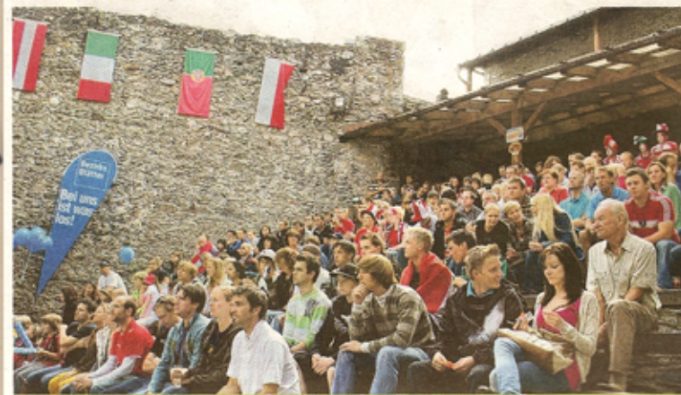
Bei Idealem Wetter verfolgten die Fans das Match - auch bei den Bildschrimen im Inneren Bereich - was möglich war bei

Alles über die Ergebnisse und Aufsteiger gibt's in der nächsten Bezirksblatt-Ausgabe.