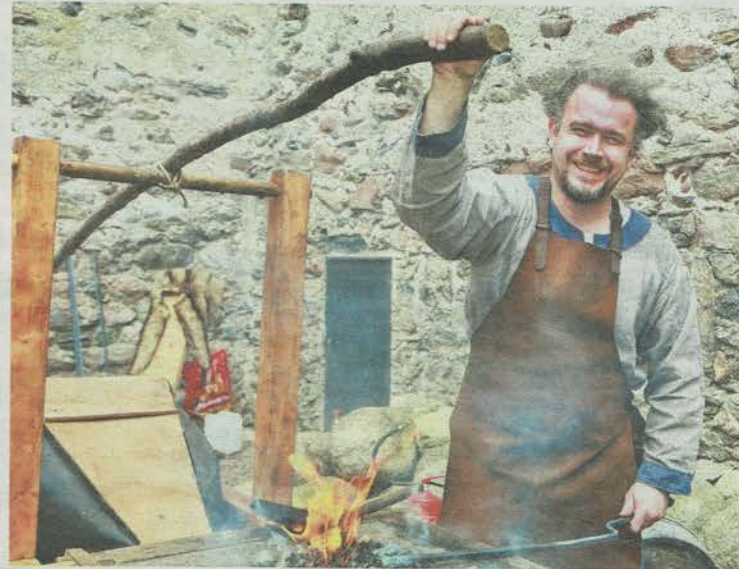
So viele wie noch nie: Bei der Frühlingsmesse auf der Burg Kaprun zeigen 53 Aussteller ihre Produkte.